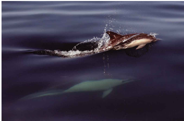
Outro trabalho premiado no concurso de 2008: «Galgando as águas», de Jorge Casais